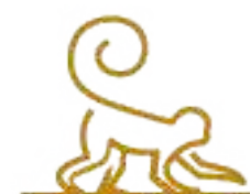
Parque Maax Significa Mono