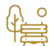
Parque Kante (Contemplación) Significa Árbol