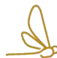
Parque Turix Significa Libélula