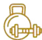
Parque Kabáh (Acondicionamiento Físico) Significa Mano dura