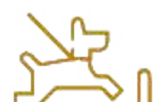
Parque Peek (Mascotas) Significa Perro