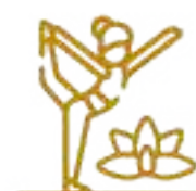
Parque Yaxkim (Zen/Yoga) Significa Sol naciente