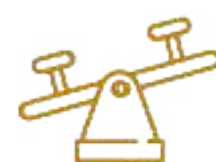
Parque Nuscaa (Infantil) Significa Tierra nueva