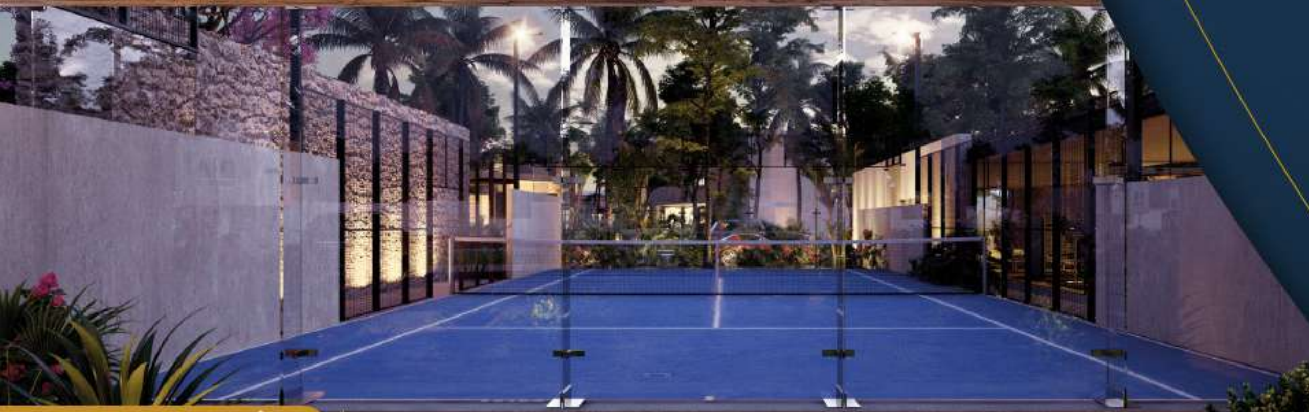
CANCHA DE PÁDEL